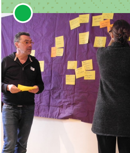
techniques d'animation © DR

Réseau AMAP Ile-de-France 47 avenue Pasteur - 93 100 Montreuil 09 52 91 79 95 • contact@amap-idf.org www.amap-idf.org