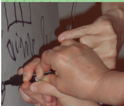
formation animation de réunion