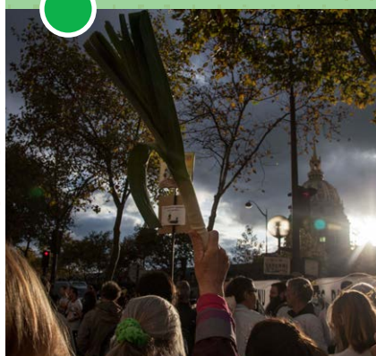
Mobilisation citoyenne devant le Ministère de l'agriculture - oct 2017

----- Réseau AMAP Ile-de-France 47 avenue Pasteur - 93 100 Montreuil 09 52 91 79 95 • contact@amap-idf.org www.amap-idf.org