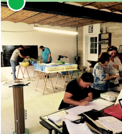
démarrage d'une AMAP

Prise en charge possible Vivéa ou CPF, + coût résiduel de 25€ par jour de formation soit 50€ les deux jours