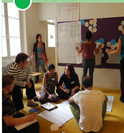
Formation Animer son partenariat - Déc 2015

Réseau AMAP Ile-de-France 47 avenue Pasteur - 93 100 Montreuil 09 52 91 79 95 • contact@amap-idf.org www.amap-idf.org