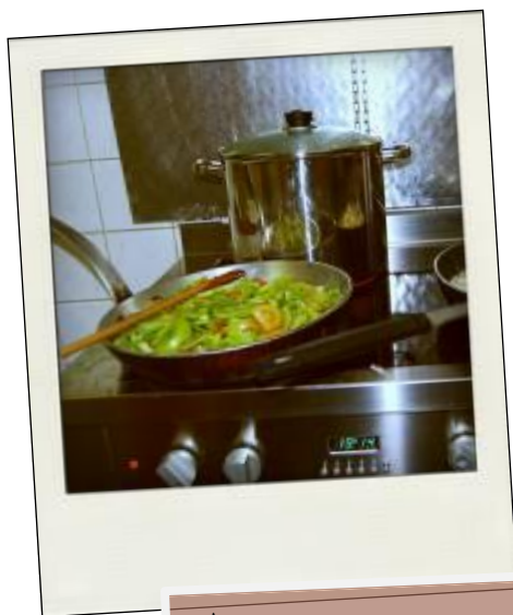
Les légumes du biocabas

Norabio organise deux réunions annuelles de concertation avec l'ensemble des producteurs. La première a lieu en octobre (produits hiver et planification printemps) et la deuxième en décembre (planification pour l'année suivante). Les prix sont validés par variété. 60% du prix du Biocabas est reversé aux producteurs et Norabio touche les 40% restant (charges). Le prix du panier n'a pas augmenté depuis 2009.