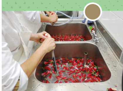
Projet Ma cantine en AMAP_Ecuelle