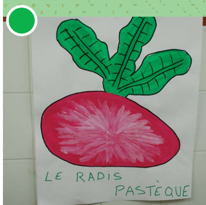
Projet Ma cantine en AMAP_Ecuelle

----- Réseau AMAP Ile-de-France 47 avenue Pasteur - 93 100 Montreuil 09 52 91 79 95 - contact@amap-idf.org www.amap-idf.org