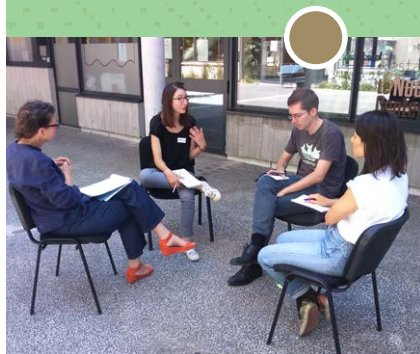
Formation Animer son partenariat - Juin 2017