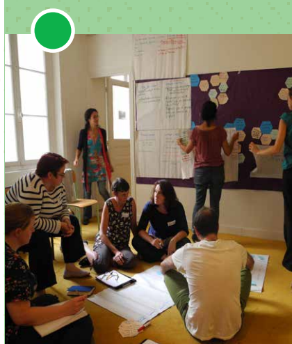
Formation Animer son partenariat - Déc 2015

Réseau AMAP Ile-de-France 47 avenue Pasteur - 93 100 Montreuil 09 52 91 79 95 - contact@amap-idf.org www.amap-idf.org